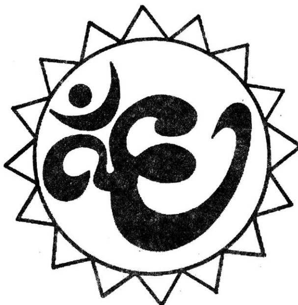
Рисунок для фиксации глаз

Вариант 3. Вокруг знака проведена окружность. Перемещайте свой взгляд по окружности, двигая одновременно глаза и голову. Делайте упражнение вначале с открытыми глазами, затем с закрытыми, представляя окружность.